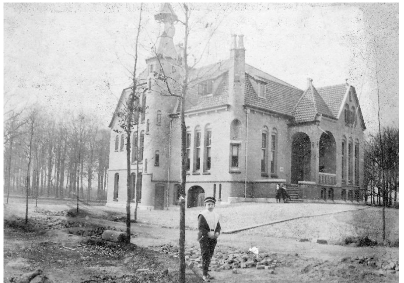
Foto: het Oude Raadhuis aan het Wilhelminapark vlak na de oplevering (ca 1900).

U kunt zich aanmelden door een mailtje te sturen aan de secretaris van de Vereniging. In dit geval is het 'wie eerst komt, eerst maalt'. Graag aanmelden uiterlijk op 28 augustus. U krijgt dan op 30/31 augustus de uitnodiging (via de mail) toegestuurd.